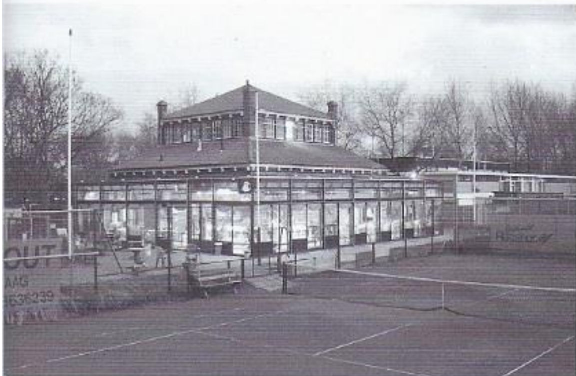
Het clubhuis, voormalig jachthuis van Willem III.

Na de oorlog werden over de gehele stad sirenes geplaatst om de burgerij tijdig te waarschuwen in geval van oorlog, zodat de Bescherming Burgerbevolking optimaal zijn werk kon doen. Deze methode bracht het bestuur op het idee ook een sirene te gaan gebruiken, wanneer men in verband met de drukte op mooie zomerdagen afwisselend de banen moest gaan bespelen.