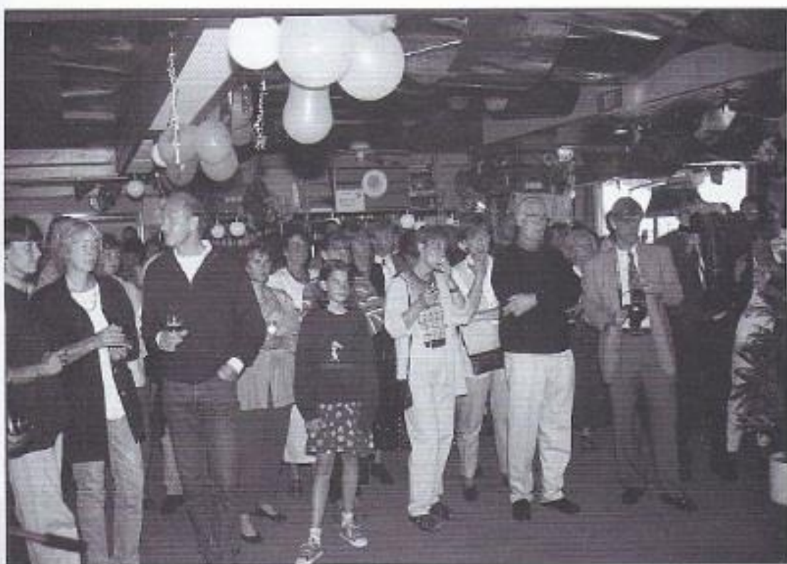
Feest op Never-Out.